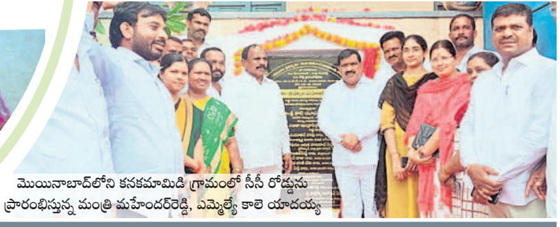
మొయినాబాద్ లోని కనకమామిడి గ్రామంలో సీసీ రోడ్డును ప్రారంభిస్తున్న మంత్రి మహేందర్ రెడ్డి, ఎమ్మెల్యే కాలె యాదయ్య