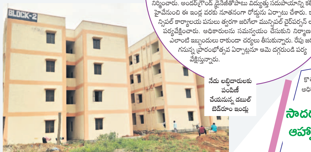
నేడు అభిదారులకు పంపిణీ చేయనున్న డబుల్ బెడ్రూం ఇండ్లు

కొత్తూరు మున్సిపాలిటీగా ఏర్పడిన తర్వాత గ్రామ పంచాయతీ భవనాన్నే మున్సిపల్ కార్యాలయంగా మార్చారు. అయితే ఇరుకైన భవనంలో పరిపాలనకు ఇబ్బందులు ఏర్పడ్డాయి. అంతేకాకుండా వాహనాల పార్కింగ్ను సౌకర్యం లేకపోవడంతో అధికారులతోపాటు పనుల నిమిత్తం కార్యాలయానికి వచ్చే పురప్రజలు కూడా ఇబ్బందిపడ్డారు. వీటిని గమనించిన మంత్రి కేటీఆర్ మున్సిపల్ ఎన్నికల్లో నూతన భవనాన్ని నిర్మిస్తామని హామీ ఇచ్చారు. ఆ హామీ మేరకు 3.5 కోట్లతో 2.5 ఎకరాల విశాల ప్రాంగణంలో సకల హంగులతో జీవన్ వన అంతస్తులతో భవనాన్ని నిర్మించారు. గ్రాండ్ ఫోర్లో సిటిజన్ సర్కిల్ సెంటర్, రెవెన్యూ, శానిటేషన్, ఇంజనీరింగ్, అకౌంట్స్, టాప్ షానింగ్, వీటిసంబంధ, కమిషన్ కార్యాలయాన్ని కూడా అక్కడే ఏర్పాటు చేశారు. మొదటి అంతస్తులో మున్సిపల్ చైర్మన్లను చాంబర్స్ ఏర్పాటు చేశారు. సమావేశ కార్యాలయాన్ని విశాలంగా నిర్మించారు. రెండు ఎకరాలలో భవనం, పార్కింగ్ కోసం స్థలాన్ని వదిలారు. మరో అర ఎకరంలో గ్రీన్ రీని ఏర్పాటు చేశారు.