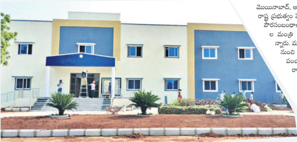
మంత్రి కేటీఆర్ ప్రారంభించనున్న కొత్తూరు మున్సిపాలిటీ కార్యాలయం

మొయినాబాద్, అక్టోబర్ 3 : గ్రామీణ రోడ్ల అభివృద్ధికి రాష్ట్ర ప్రభుత్వం పెద్దపీట వేసిందిని రాష్ట్ర సమాచార, పౌరసంబంధాలు, గనులు, భూగర్భ వనరుల శాఖల మంత్రి డాక్టర్ పట్నం మహేందర్ రెడ్డి ఆస్కారం. మండలంలోని కనకమామిడి గ్రామం నుంచి వెంకటాచార్య గ్రామం వరకు ఉన్న పంచాయతీరాజ్ రోడ్డు బీటీ పనులకు రాష్ట్ర ప్రభుత్వం రూ.8.50 కోట్లు మంజూరు చేసిన నేపథ్యంలో ఆ పనుల ప్రారంభానికి మంగళ వారం ఆయన కనకమామిడి గేట్ వద్ద శంకుస్థాపన చేశారు. అదేవిధంగా గ్రామంలో నూతనంగా నిర్మించిన అంతర్గత మురుగు కాలువలు, సీసీ రోడ్లను చేపట్టే