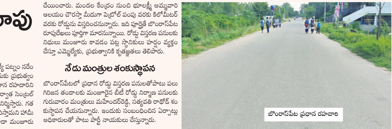
బొంరాస్ పేట ప్రధాన రహదారి

నేడు మంత్రుల శంకుస్థాపన బొంరాస్ పేటలో ప్రధాన రోడ్డు విస్తరణ పనులతోపాటు పలు గిరిజన తప్పిదాలకు మంజూరైన బీటీ రోడ్డు నిర్మాణ పనులకు గురువారం మంత్రులు మహేందర్ రెడ్డి, సత్యవతి రాజ్ డి శంకుస్థాపన చేయనున్నారు. ఇందుకు సంబంధించిన ఏర్పాట్లు అధికారులతో పాటు పార్టీ నాయకులు చేస్తున్నారు.