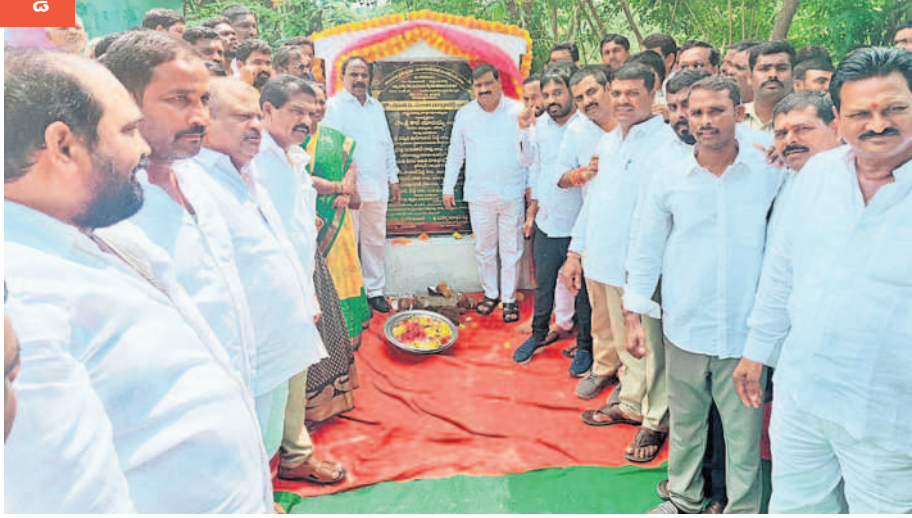
కనకమామిడి గ్రామంలో రోడ్డు నిర్మాణ పనులకు శంకుస్థాపన చేస్తున్న మంత్రి మహేందర్ రెడ్డి, ఎమ్మెల్యే కాలి యాదయ్య

ఎమ్మెల్యే కాలి యాదయ్య, ఎంపీపీ గునుగర్తి నక్షత్రం, జడ్పీటీసీ కాలి శ్రీకాంత్ కలిసి ప్రారంభించారు. ఈ సందర్భంగా ఆయన మాట్లాడుతూ గ్రామీణ రోడ్ల అభివృద్ధికి రాష్ట్ర ప్రభుత్వం అధిక ప్రాధాన్యం ఇస్తున్నదన్నారు. గ్రామాల్లోని సీసీ రోడ్లు, అంతర్గత మురుగు కాలువల నిర్మాణంతోపాటు గ్రామాలకు ఉన్న పంచాయతీరాజ్, జిల్లా పరిషత్ రోడ్ల అభివృద్ధికి ప్రభుత్వం అధిక నిధులను కేటాయిస్తుందన్నారు. ఒక వైపు అభివృద్ధి, మరోవైపు సంక్షేమం జోడిస్తూ పనులను తీసుకుంటున్నారన్నారు. సీఎం కేసీఆర్ తీసుకుంటున్న చర్యలు రాష్ట్రం అన్ని రంగాల్లో అగ్రగామిగా నిలిచిందన్నారు. సంక్షేమ పథకాల అమల్లో తెలంగాణ దేశానికే ఆదర్శంగా మారాలని కోనియోడారు. రాష్ట్రంలో అమలుతున్న సంక్షేమ పథకాలను ఇంటింటికీ విస్తృతంగా తీసుకెళ్లాలని బాధ్యత ప్రతి ఒక్కరిపై ఉందన్నారు. మొయినాబాద్ మండలంలోని అన్ని గ్రామాల అభివృద్ధికి నిధులు మంజూరుయ్యాయని, మూల, ఏకాలు ఆశాజ్యోతి రమ్య, బీఆర్ఎస్ మంత్రి కర్పూర్ తే ఆ పనులను కూడ పూర్తి చేస్తామన్నారు. కార్యక్రమంలో