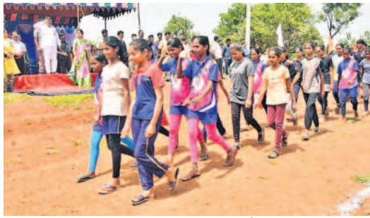
మంత్రికి గౌరవ వందనం చేస్తున్న క్రీడాకారులు