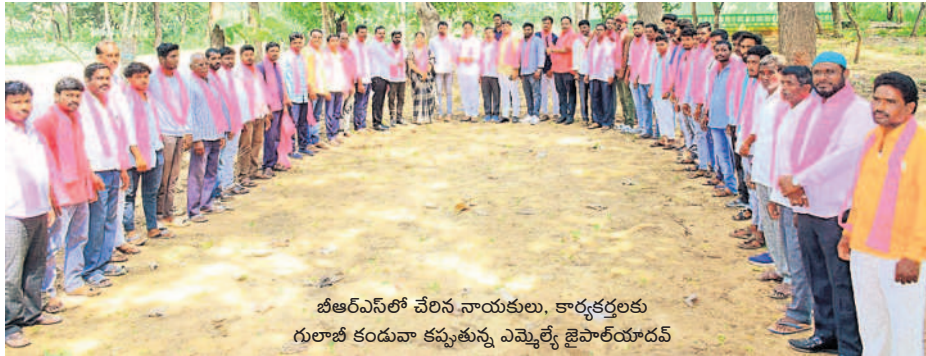
బీఆర్ఎస్ లో చేరిన నాయకులు, కార్యకర్తలకు గులాబీ కండువా కప్పతున్న ఎమ్మెల్యే జైపాల్ యాదవ్