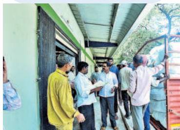
గోడౌన్ నుంచి నిర్దేశిత ప్రాంతాలకు చీరలను తరలిస్తున్న సిబ్బంది

లిటీలు, మండలాలకు చీరలను తరలించారు. చీరలను అన్ని శాఖల సమన్వయంతో పంపిణీ చేసేలా టెన్సో అధికారులు ఏర్పాట్లు చేస్తున్నారు. జిల్లాస్థాయిలో జిల్లా గ్రామీణాభివృద్ధి శాఖ, చేనేత జాళి శాఖలు, రెవెన్యూ డివిజన్ స్థాయిలో ఆర్డీవో, మండలస్థాయిలో ఎంపీడీవో, తహసీల్దార్, గ్రామస్థాయిలో పలు శాఖల సిబ్బంది సహకారంతో చీరలను పంపిణీ చేయనున్నారు. బుధవారం మంత్రి సబితా ఇంద్రారెడ్డి కౌకుంట్లతోపాటు శంకర్పల్లి మున్సిపాలిటీలో చీరల పంపిణీ చేయనున్నారు. మిగతాచోట్ల ఎమ్మెల్యేలు అందజేసేందుకు అధికారులు ఏర్పాట్లు చేశారు.