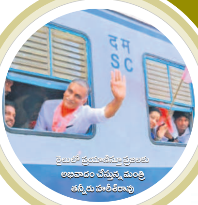
రైలులో ప్రయాణిస్తున్న ప్రజలకు అభివాదం చేస్తున్న మంత్రి తన్నీరు హరీశ్ రావు