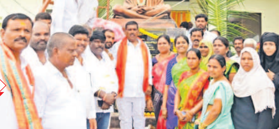
గుమ్మడిదల: బొంతపల్లిలో నూతన పంచాయతీ భవనాన్ని ప్రారంభిస్తున్న పటాన్చెరు ఎమ్మెల్యే గూడెం మహిపాల్ రెడ్డి