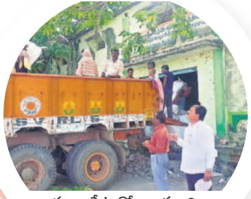
సూర్యాపేట గోదాం నుంచి మండలాలకు బతుకమ్మ చీరల తరలింపు

అక్టోబర్(ఎన్) మండలంలో 20,192 మంది, చివ్వెలంలో 18,198, పెన్పహాడంలో 14,720, సూర్యాపేట పట్టణంలో 28,747, సూర్యాపేట రూరల్లో 20,229 జాజిడిగూడెంలో 11,254, నూతనకల్లో 12,878, నాగారంలో 11,819, మద్దిలాలలో 12,056, తిరుమలగిరి మున్సిపాలిటీలో 7,818, తిరుమలగిరి రూరల్లో 7,482, తుంగభద్రలో 16,403, అనంతగిరిలో 12,105, మోతెలో 16,856, చిలుకూరులో 14,714, కోదాడ పట్టణంలో 19,177, కోదాడ రూరల్లో 18,059, మునుగలలో 16,113, నడిగూడెంలో 11,298, చింతలపాలెంలో 13,757, గడిపల్లిలో 20,223, హుజూర్ నగర్ పట్టణంలో 11,241, హుజూర్ నగర్ రూరల్లో 9,192, మచిలీపట్నంలో 16,512, మెళ్లచెర్వులో 14,293, నేడపల్లె మున్సిపాలిటీలో 4,218, నేడపల్లె రూరల్లో 9,419, పాలకవీడు మండలంలో 9,347 మంది మహిళలకు బతుకమ్మ చీరలు ఇవ్వనున్నారు.