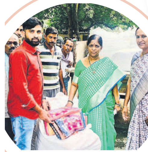
మిర్యాలగూడ గ్రామం : బతుకమ్మ చీరలను కిష్టాపురం రామపంచాయతీ కార్యదర్శికి అందజేస్తున్న ఎంపీపీ సరళ

బతుకమ్మ చీరలను మరింత నాణ్యత, విభిన్న డిజైన్లతో తీసుకురావాలని రాష్ట్ర ప్రభుత్వం భావిస్తున్నది. అందులో భాగంగా ప్రతి సంవత్సరం అంతకుతక్కువ క్వాలిటీ పెంచుతున్నది. మహిళల నుంచి అభిప్రాయాలు సేకరించి చీరలను తయారు చేయనున్నది. పోయినసారి కంటి ఈ సారి మరింత ఆకర్షణీయంగా ఉండనున్నాయి. పాఠశాలకు తావులేకుండా, ఎక్కడా వెనక్కి తగ్గుకుండా ఈ సారి మరింత క్వాలిటీతో చీరలను నేయించారు. సరికొత్త రంగులు, డిజైన్లతో రూపొందించారు. తొలుత 15 రంగులతో తయారు చేయగా.. ఇప్పుడు సుమారు 25 రంగులతో 250 డిజైన్లతో చీరలను ఉండేలా, బుట్టాలు, జరితో తయారు చేయించారు. ఆరు మీటర్ల పొడవుగల సాదారణ చీరలకు అదనంగా వృద్ధ మహిళల ధరించే తొమ్మిది మీటర్ల పొడవు చీరలను కూడా నేయించారు. నేటి నుంచి ఎమ్మెల్యేలు, ప్రజాప్రతినిధుల చేతుల మీదుగా చీరల పంపిణీ చేయనుండగా.. జిల్లా అధికారులు అన్ని ఏర్పాట్లు చేశారు. కొన్నిచోట్ల మంగళవారం ముందస్తుగా చీరల పంపిణీ చేశారు.