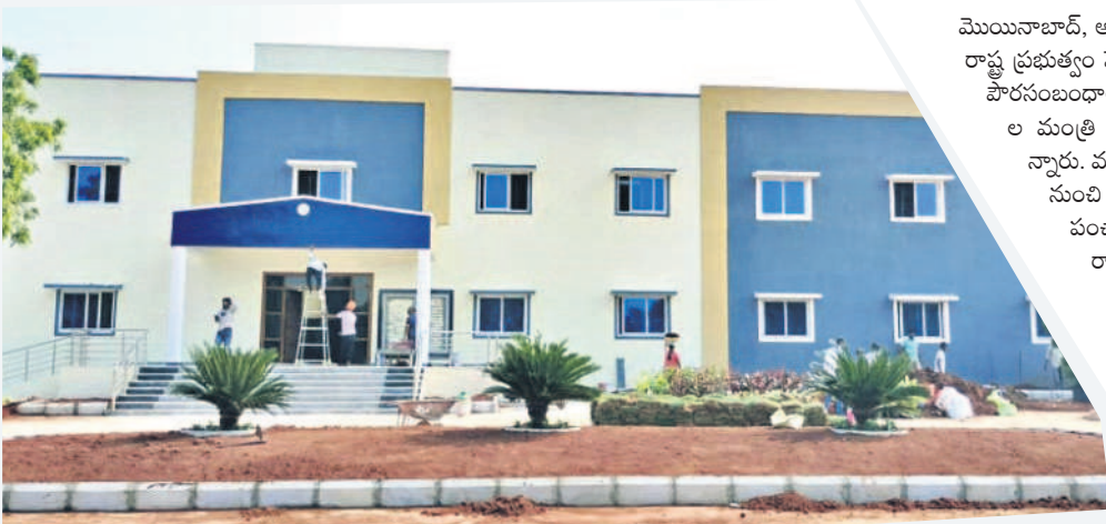
మంత్రి కేటీఆర్ ప్రారంభించనున్న కొత్తూరు మున్సిపాలిటీ కార్యాలయం