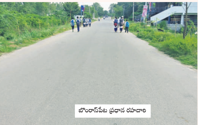
బొంరాస్ పేట ప్రధాన రహదారి

బొంరాస్ పేటలో ప్రధాన రోడ్డు విస్తరణ పనులతోపాటు పలు గిరిజన తప్పిదాలకు మంజూరైన బీటీ రోడ్డు నిర్మాణ పనులకు గురువారం మంత్రులు మహేందర్ రెడ్డి, సత్యవతి రాజ్ గౌడ్ శంకుస్థాపన చేయనున్నారు. ఇందుకు సంబంధించిన ఏర్పాట్లు అధికారులతో పాటు పార్టీ నాయకులు చేస్తున్నారు.