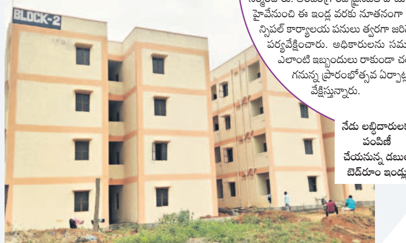
నేడు అభిదారులకు పంపిణీ చేయనున్న డబుల్ బెడ్రూం ఇండ్లు

కొత్తూరు మున్సిపాలిటీగా ఏర్పడిన తర్వాత గ్రామ పంచాయతీ భవనాన్నే మున్సిపల్ కార్యాలయంగా మార్చారు. అయితే ఇరుకైన భవనంలో పరిపాలనకు ఇబ్బందులు ఏర్పడ్డాయి. అంతేకాకుండా వాహనాల పార్కింగ్ను సౌకర్యం లేకపోవడంతో అధికారులతోపాటు పనుల నిమిత్తం కార్యాలయానికి వచ్చే పురప్రజలు కూడా ఇబ్బందిపడ్డారు. వీటిని గమనించిన మంత్రి కేటీఆర్ మున్సిపల్ ఎన్నికల్లో నూతన భవనాన్ని నిర్మిస్తామని హామీ ఇచ్చారు. ఆ హామీ మేరకు 9.5 కోట్లతో 2.5 ఎకరాల విశాల ప్రాంగణంలో సకల హంగులతో జీవన్ వన అంతస్తులో భవనాన్ని నిర్మించారు. గ్రాండ్ ఫినిష్ లో సిటిజన్ సర్కిల్స్ సెంటర్, రెవెన్యూ శానిటేషన్, ఇంజనీరింగ్, ఆకౌంట్స్, టాప్ గ్రాఫింగ్, వీటిసంబంధ, కమిషనరీ కార్యాలయాన్ని కూడా అక్కడే ఏర్పాటు చేశారు. మొదటి అంతస్తులో మున్సిపల్ లైబ్రరరీ, వాంటర్ ను ఏర్పాటు చేశారు. సమావేశ కార్యాలయాన్ని విశాలంగా నిర్మించారు. రెండు ఎకరాలలో భవనం, పార్కింగ్ కోసం స్థలాన్ని వదిలారు. మరో అర ఎకరంలో గ్రీన్ రీని ఏర్పాటు చేశారు.