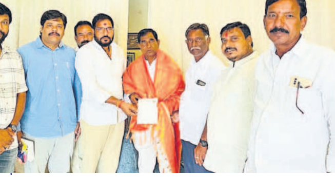
ఎమ్మెల్యే అంజయ్యయాదవ్ను ప్రారంభోత్సవం ఆహ్వాన పుత్రికను అందజేస్తున్న కొత్తూరు బీఆర్ఎస్ నాయకులు

చేయించారు. మండల కేంద్రం నుంచి భూలక్ష్మి అమ్మవారి ఆలయం చౌరస్తా మీదుగా పెట్రోల్ పంపు వరకు కిలోమీటర్ వరకు రోడ్డును విస్తరించనున్నారు. ఇది పూర్తైతే బొంరాస్ పేట రూపురేఖలు పూర్తిగా మారనున్నాయి. రోడ్డు విస్తరణ పనులకు నిధులు మంజూరు కావడం పట్ల స్థానికులు హర్షం వ్యక్తం చేస్తూ ఎమ్మెల్యేకు, ప్రభుత్వానికి కృతజ్ఞతలు తెలిపారు.