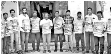
వాలే పోస్టర్ ను విడుదల చేస్తున్న ఫాటో గ్రాఫర్ల సంఘం నాయకులు