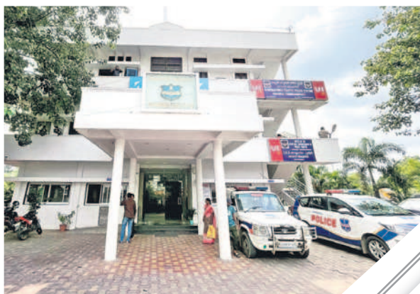
హనుమకొండలోని మాడల్ పాలీస్టేషన్

- వరంగల్, అక్టోబర్ 3(నమస్తే తెలంగాణ)/ హనుమకొండ చౌరస్వా