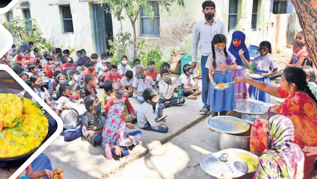
మట్టివాడలోని ప్రభుత్వ పాఠశాలలో మధ్యాహ్న భోజనం చేస్తున్న విద్యార్థులు