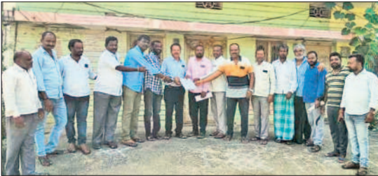
సంఘం తీర్మానం కాపీని సర్పంచ్కు అందిస్తున్న పరపతి సంఘం సభ్యులు