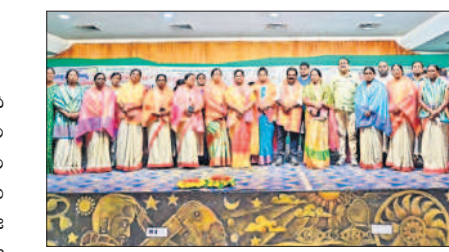
మహిళలను సన్నాహిస్తున్న ఎమ్మెల్యే అరూల రమేశ్

కాశీబుగ్గ, అక్టోబర్ 3 : మహిళలు అన్ని రంగాల్లో సాధికారత సాధించడంతోపాటు ఆర్థికంగా బలోపేతమయ్యేందుకు బీఆర్ఎస్ ప్రభుత్వం అన్ని విధాలూ కృషి చేస్తోందని వర్ధన్నపేట ఎమ్మెల్యే బీఆర్ఎస్ పార్టీ జిల్లా అధ్యక్షుడు అరూల రమేశ్ తెలిపారు. మంగళవారం ఆరెపల్లిలోని పజ్జ గార్డెన్స్ లో 3వ డివిజన్ ఎస్ఎల్ఎఫ్ మహిళా సమాఖ్య సంఘాల వార్షిక మహాసభ జరిగింది. ఈ కార్యక్రమానికి ముఖ్యఅతిథిగా ఎమ్మెల్యే అరూల రమేశ్ హాజరై మాట్లాడారు. రాష్ట్రంలో మహిళా సాధికారత కోసం అనేక