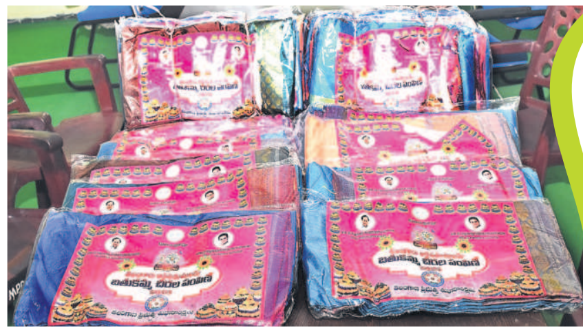
యాదగిరిగుట్ట ఎంపీడీఓ కార్యాలయానికి చేరిన రంగురంగుల బతుకమ్మ వీరెలు

రకరకాల రంగులు.. 250 డిజైన్లు.. బతుకమ్మ వీరెలను మరంత నాణ్యత, విభిన్న డిజైన్లతో తీసుకురావాలని ప్రభుత్వం భావిస్తున్నది. అందులో భాగంగా ప్రతి సంవత్సరం అంతకంతకూ క్వాలిటీ పెంచుతున్నది. మహిళల నుంచి అభిప్రాయాలు సేకరించి వీరెలను తయారు చేయిస్తున్నది. పోయినసారి కంటే ఈ సారి మరింత ఆకర్షణీయంగా ఉండనున్నాయి. పాఠశాలలకు తావులేకుండా, ఎక్కడా వెనక్కి తగ్గకుండా ఈ సారి మరింత క్వాలిటీతో వీరెలను నేయించారు. సరికొత్త రంగులు, డిజైన్లతో రూపొందించారు. 250 డిజైన్లతో వీరెలను తయారు చేయించారు. ఈ సారి వీరెలకు డాబ్బీ అంచు ఉండేలా, బుట్టలు, జరితో తయారు చేయించారు. ఆరు మీటర్ల పొడవుగల సాధారణ వీరెలకు అదనంగా వృద్ధ మహిళలు ధరించే తొమ్మిది మీటర్ల పొడవు గల వీరెలను కూడా నేయించారు.