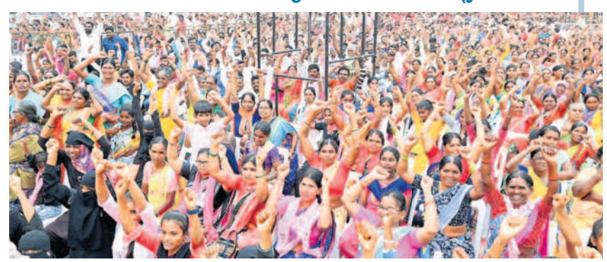
జోష్ నింపిన మంత్రుల పర్యటనలు

గత వారం రోజుల్లోనే నాలుగు నియోజకవర్గాల్లో గత వారం రోజుల్లోనే నాలుగు నియోజకవర్గాల్లో మంత్రులు కేటీఆర్, హరీశ్ రావు పర్యటనలు పార్టీ శ్రేణుల్లో మరింత జోష్ నింపాయి. గత నెల 29 నుంచి హరీశ్ రావు, జిల్లా మంత్రి గుంటకండ్ల జగదీశ్ రెడ్డితో కలిసి సీట్ కేంద్రం, కుంగత్తు నియోజకవర్గాల్లో పర్యటించారు. పలు అభివృద్ధి కార్యక్రమాలకు ప్రారంభోత్సవాలు, శంకు స్థాపనలు చేస్తూ నియోజకవర్గాల ప్రగతిని వివేచన సభల్లో పాల్గొన్నారు. కాంగ్రెస్, బీజేపీ వైపలాలు ఎండగ దుతూ.. కేటీఆర్ వచ్చాక జరిగిన అభివృద్ధిని వివరించారు. ముఖ్య కార్యకర్తలతో బాగానే చెరువులు.. మోపూరు, ట్రాన్స్ఫార్మర్లు కాలకుండా నాణ్యమైన కరెండు, సరీసాగు ఇస్తున్న ఎరువుల గురించి చెప్పారు. దీంతో తెలంగాణ రాష్ట్రం దేశానికి ధాన్యగ్రామం, నల్లగొండ రాష్ట్రానికి రాష్ట్రం దాడిగా ధాన్యం ఇస్తున్నదని తెలిపారు. కాంగ్రెస్ నేతలకు పద పుల మీద, సైరపీ మీద డ్రైవు.. వాళ్ళ కడుపు నింపుకోనే ఆలోచనల మీద డ్రైవు.. ప్రజల కోసం ఏ ఆలోచనా చేయాలి అనే ప్రజలకు వివరించి చెప్పారు. రాష్ట్ర బిల్లు, పురపాలక శాఖ మంత్రి కేటీఆర్ జిల్లా మంత్రి జగదీశ్ రెడ్డితో కలిసి సోమవారం సుర్యాపేట, నల్లగొండ జిల్లా కేంద్రాల్లో పర్య