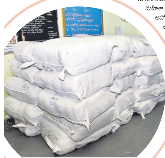
యాదగిరిగుట్ట ఎంపీడీఓ కార్యాలయానికి చేరిన బతుకమ్మ వీరెలు

అడ్డగూడూరు మండలంలో 10,006, ఆలేరు మండలంలో 9,055, ఆలేరు పట్టణంలో 5,552, ఆత్మకూరు (ఎం)లో 10,120, భువనగిరి మండలంలో 18,092, భువనగిరి పట్టణంలో 16,232, బీబీనగర్లో 16,232, బొమ్మలూరూరంలో 13,092, చౌబుప్పల్ మండలంలో 16,256, చౌబుప్పల్ పట్టణంలో 10,221, గుండాలలో 11,861, మోటకొండూరులో 8,599, మోతకూరు మండలంలో 5,895, మోతకూరు పట్టణంలో 5,860, తర్కపల్లిలో 12,262, నారాయణపురంలో 14,616, పోచంపల్లి మండలంలో 9,999, పోచంపల్లి పట్టణంలో 5,407, రాజాపేటలో 13,848, రామస్వమీటల్ 18,794, పలిగొండలో 19,341, యాదగిరిగుట్ట మండలంలో 12,538, యాదగిరి గుట్ట పట్టణంలో 5,121మందికి బతుకమ్మ వీరెల పంపిణీ చేయనున్నారు.