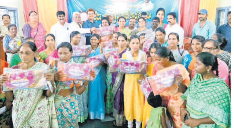
ఇల్లెందు రూరర్ : బతుకమ్మ చీరలు పంపిణీ చేస్తున్న ఎమ్మెల్యే వారిప్రయినాయక్

ఉమ్మడి జిల్లావ్యాప్తంగా పండుగ వాతావరణం గ్రామాలు, పట్టణాల్లో 'బతుకమ్మ' చీరల పంపిణీ షురూ.. ఖమ్మంలో మంత్రి అజయ్ కుమార్, ఆయా నియోజకవర్గాల్లో ఎమ్మెల్యేల చేతుల మీదుగా.. చీరలను మురిపెంగా అందుకుని మురిసిన మహిళలు సీఎం కేసీఆర్ కు కృతజ్ఞతలు