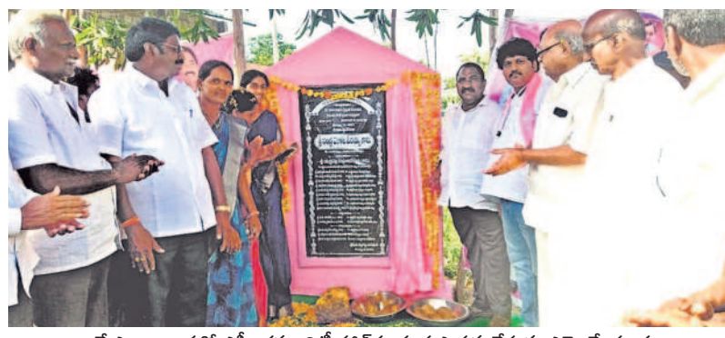
కే.ఎం.బంజరలో ఎస్సీ కమ్యూనిటీ హాల్ కు శంకుస్థాపన చేస్తున్న ఎమ్మెల్యే సంద్య