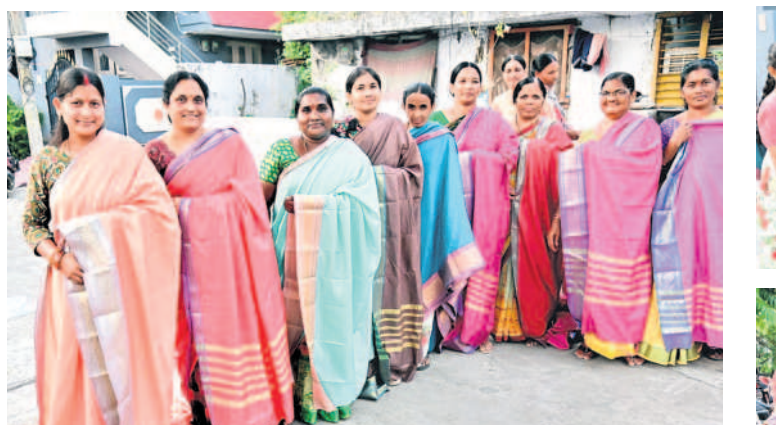
ఖమ్మంలో ఐతహాసం చీరలతో మహిళల సందడి

తెలంగాణ ఆదనమచులకు ప్రీతిపాత్రమైన పండుగ.. సంస్కృతి సంప్రదాయాలను ప్రతిబింబించే వేడుక.. ఆదరణల మెట్టింటి నుంచి పుట్టింటికి వచ్చి జరుపుకునే బతుకమ్మ పండుగ, పేద ధనిక తేడా లేకుండా మహిళలందరూ కొత్త చీరలు ధరించి జరుపుకునే వైభవోపేతమైన పండుగకు సీఎం కేసీఆర్ ఏటా చీరలు పంపిణీ చేయడం ఆనవాయితీ. తెలంగాణ సిద్ధించిన తర్వాత సర్కారు కానుకగా అందించే చీరలు ధరించి మహిళలు పండుగ చేసుకోవాలనే ఉద్దేశంతో సీఎం కేసీఆర్ బతుకమ్మ చీరల పంపిణీ క్రీకారం మళ్లారు. ఉమ్మడి జిల్లావ్యాప్తంగా మంత్రి, ఎమ్మెల్యేలు, ప్రజాప్రతినిధులు మహిళలకు బతుకమ్మ చీరలను పండుగ వాతావరణంలో బుద్ధవారం పంపిణీ చేశారు. సంకీర్షణా చీరలు అందుకున్న మహిళలు సీఎం కేసీఆర్ కు కృతజ్ఞతలు తెలిపారు. - నమస్తే తెలంగాణ