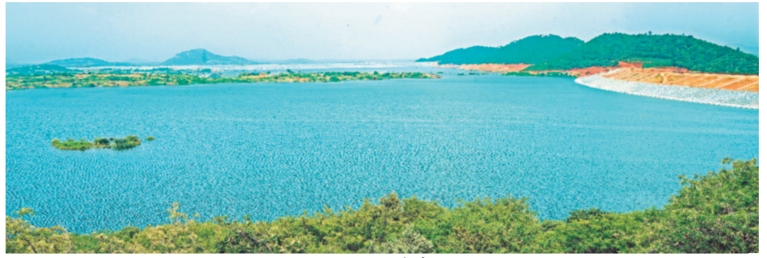
పాలమూరు రంగారెడ్డి మొదటి లిఫ్ట్ మోటర్-1 నుంచి నీటిని ఎత్తిపోయడంతో 1.5 టీఎంసీలకు పైగా చేరిన జలాలతో కళకళలాడుతున్న అంజనిగిరి రిజర్వాయర్