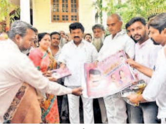
మంత్రి తలసాని శ్రీనివాస్ యాదవ్ జన్మదిన వాల్ పోస్టర్ ను ఆవిష్కరిస్తున్న మంత్రి తలసాని శ్రీనివాస్ యాదవ్