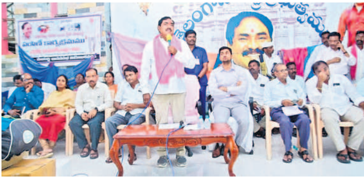
మాట్లాడుతున్న మంత్రి ఎర్రబెల్లి దయాకర్ రావు