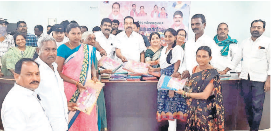
కోరుట్ల రూరల్: బతుకమ్మ చీరలను పంపిణీ చేస్తున్న ఎమ్మెల్యే కల్వకుంట్ల విద్యాసాగర్ రావు