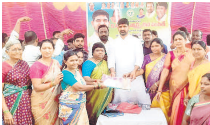
హుజూరాబాద్: మహిళలకు చీరలను పంపిణీ చేస్తున్న మండలి విప్ పాడి కొశికిరెడ్డి