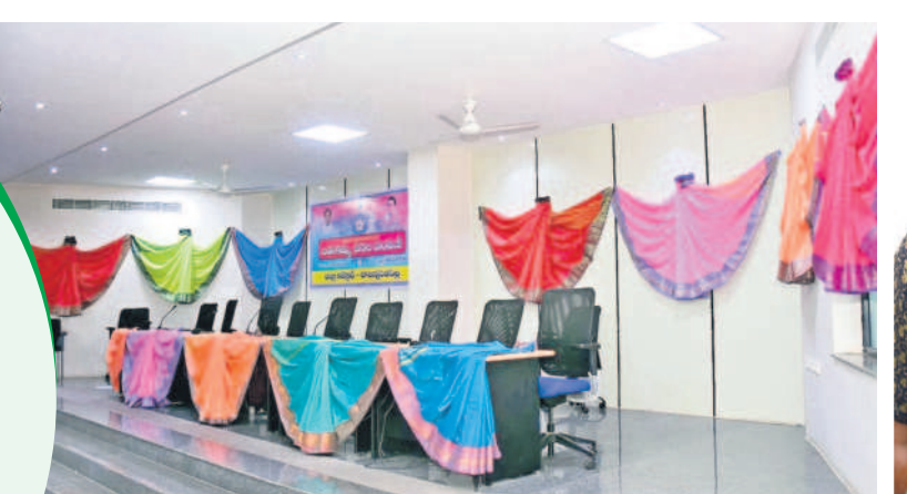
సిరిసిల్లలో వివిధ రంగుల్లో తయారైన బతుకమ్మ చీరలు