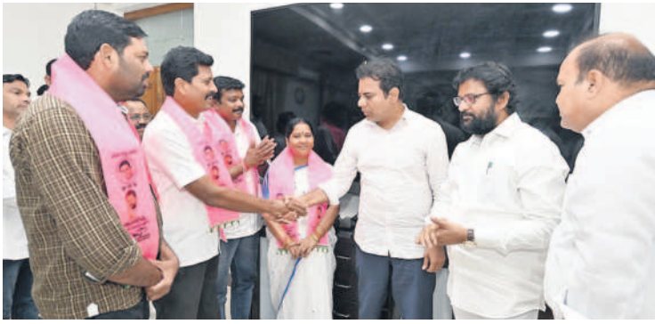
బీఆర్ఎస్లో చేరిన కాంగ్రెస్, బీజేపీలకు చెందిన ముగ్గురు కార్యకర్తలను ఆహ్వానిస్తున్న మంత్రి కేటీఆర్