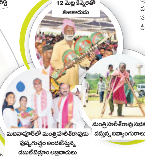
12 మెట్ల కిన్నెరతో కళాకారులు మదనాపూర్ లో మంత్రి హరీశ్ రావుకు వస్తున్న దివాంగురాలు