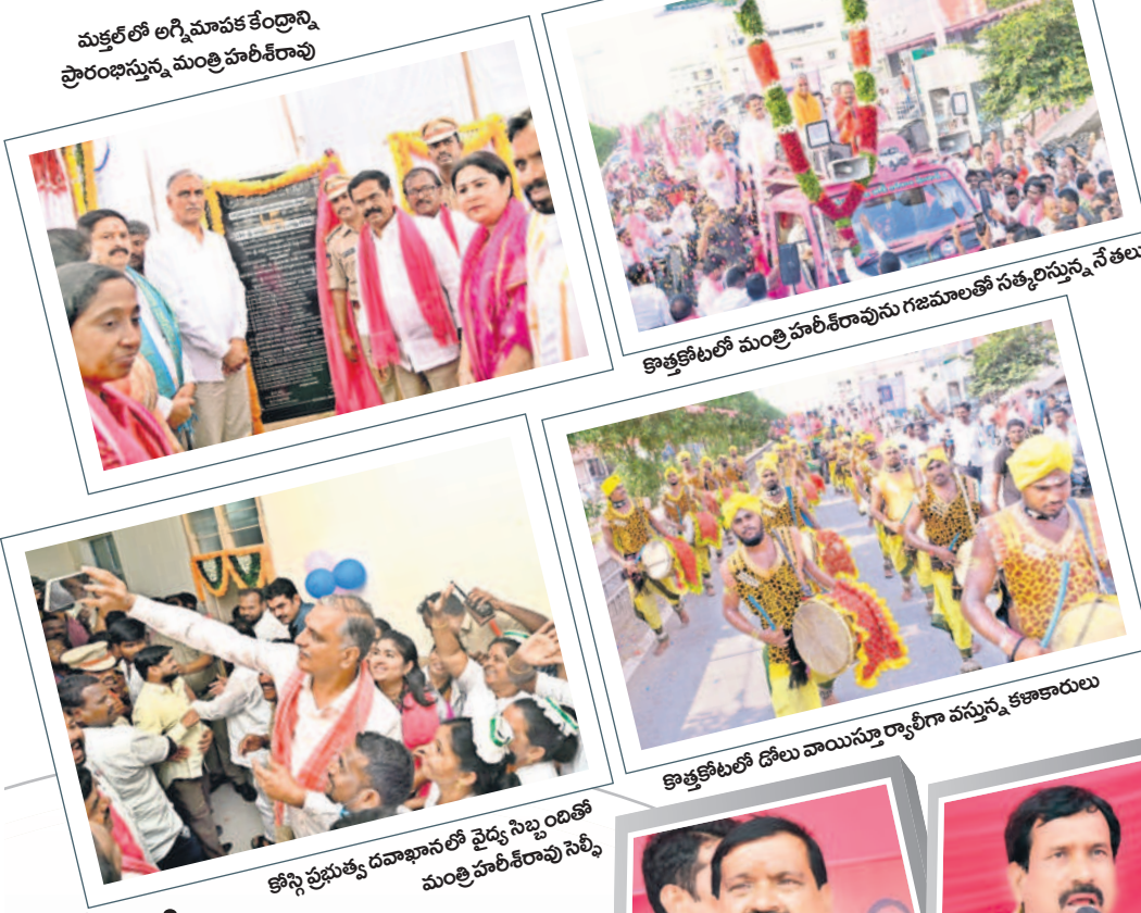
ముక్తల్ అగ్నిమాపక కేంద్రాన్ని ప్రారంభిస్తున్న మంత్రి హరీశ్ రావు