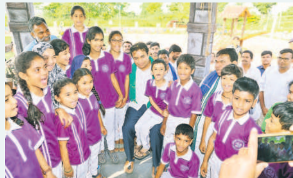
పాఠశాల విద్యార్థులతో మాట్లాడుతున్న మంత్రి కేటీఆర్, స్పీకర్ పోచారం