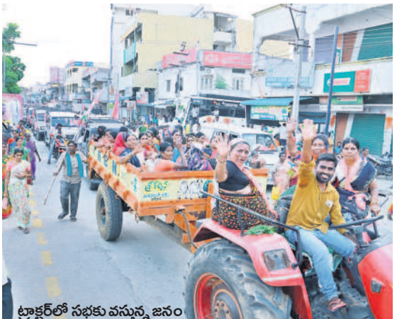
ట్రాక్టర్లో సభకు వస్తున్న జనం