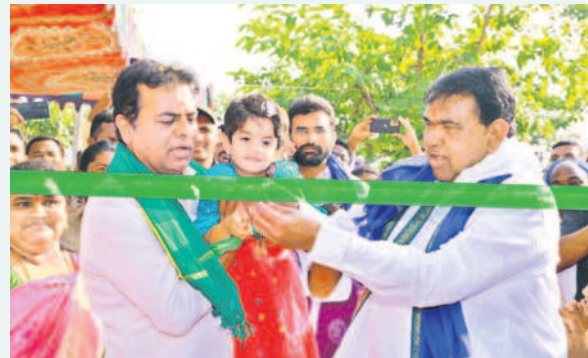
చిన్నారి తో కలిసి పార్కును ప్రారంభిస్తున్న మంత్రి కేటీఆర్, స్పీకర్ పోచారం