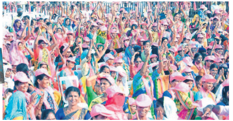
చేతులెత్తి స్పీకర్ పోచారం శ్రీనివాసరెడ్డికి మద్దతు తెలుపుతున్న ప్రజలు