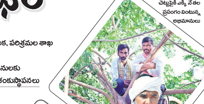
చెట్టుపైకి ఎక్కి నేతల ప్రసంగం వింటున్న అభిమానులు