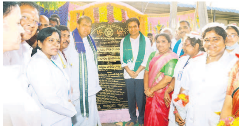
ఏరియా దవాఖాన భవనానికి శంకుస్థాపన చేస్తున్న మంత్రి కేటీఆర్, స్పీకర్ పోచారం, జడ్పీ చైర్మన్ దశాధర్ శోభ