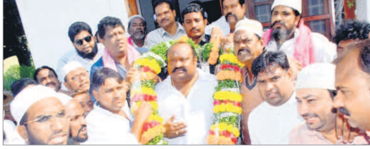
మంత్రి గంగుల కమలాకర్ ను సన్మానిస్తున్న మైనార్టీ నాయకులు

కొత్తపల్లి, అక్టోబర్ 4: కరీంనగర్ నియోజకవర్గాన్ని అభివృద్ధి పథంలో ముందుకు తీసుకెళ్తున్న మంత్రి గంగుల కమలాకర్ ను నాలుగోసారి భారీ విజయం అందించి అసెంబ్లీకి పంపుతామని మైనార్టీ నాయకులు పేర్కొన్నారు. నగరంలోని క్యాంపు కార్యాలయంలో బుధవారం మంత్రి గంగుల కమలాకర్ ను మైనార్టీ నాయకుడు సయ్యద్ మజీద్ ఆధ్వర్యంలో నాయకులు గజ మాలతో సత్కరించారు. ఈ సందర్భంగా వారు