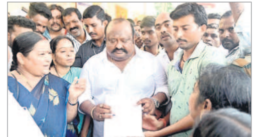
లబ్ధిదారులకు చెక్కు అందజేస్తున్న మంత్రి గంగుల కమలాకర్