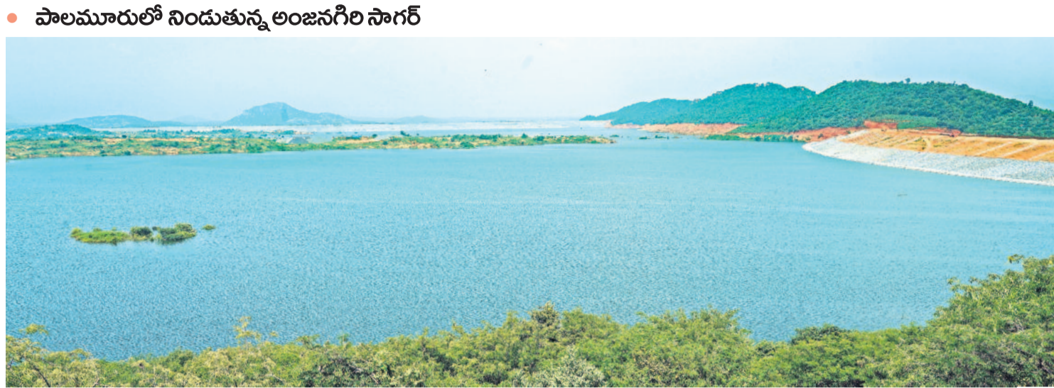
పాలమూరు రంగారెడ్డి మొదటి లిఫ్ట్ మోటర్-1 నుంచి నీటిని ఎత్తిపోయడంతో 1.5 టీఎంసీలకు పైగా చేరిన జలాలతో కళకళలాడుతున్న అంజనగిరి రిజర్వాయర్