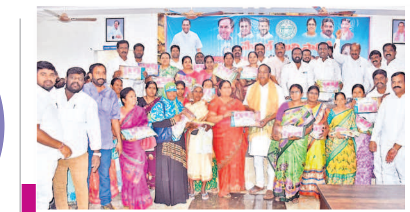
బతుకమ్మ చీరల పంపిణీ మేడ్చల్ ఎంపీపీ కార్యాలయం, మున్సిపాలిటీ కార్యాలయంలో బుద్ధవారం నిర్వహించిన బతుకమ్మ చీరలు, కల్కాల లక్ష్మి చెరెలు, క్రీడా సామగ్రి పంపిణీ చేసిన రాష్ట్ర కార్యక శాఖా మంత్రి చామకూర మల్లారెడ్డి - మేడ్చల్, అక్టోబర్