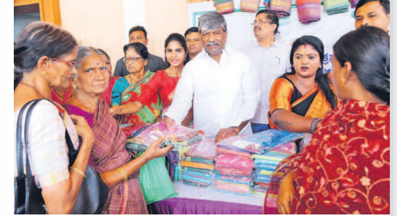
సికింద్రాబాద్ లోని సీతాఫల్మంది ఎమ్మెల్యే క్యాంప్ కార్యాలయంలో డిప్యూటీ స్పీకర్ పద్మారావు గౌడ్ బుద్ధవారం బతుకమ్మ చీరల పంపిణీ కార్యక్రమాన్ని లాంఛనంగా ప్రారంభించారు. నియోజకవర్గ పరిధిలోని అడ్డగుట్ట, వెట్టుగూడ, సీతాఫల్మంది, బొద్దనగర్, తారాకర్, డివిజన్లలో కలిపి 17 కేంద్రాల ద్వారా 65,972 మందికి బతుకమ్మ చీరలను పంపిణీ చేయనున్నారు. - సికింద్రాబాద్, అక్టోబర్ 4