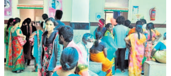
రామాయంపేట ప్రభుత్వ దవాఖానలో డాక్టర్ వద్ద క్యూలైన్లో రోగులు

రామాయంపేట, అక్టోబర్ 4: సీజనల్ వ్యాధులతో ప్రభుత్వ కమ్యూనిటీ దవాఖాన రామాయంపేట రోగుల తాకిడి పెరిగింది. బుధవారం ఎన్నడూ లేనంతగా రోగులు అధిక సంఖ్యలో రావడంతో వైద్యులు, సిబ్బంది పలు ఇబ్బందులను ఎదుర్కొన్నారు. సుమారు 400 మంది ఓపీ కోసం సుమారు క్యూలైన్లో నిల్చున్నారు. ప్రభుత్వ దవాఖానల్లో తెలంగాణ ప్రభుత్వం అన్ని సౌకర్యాల కల్పించడంతో ఓపీ సంఖ్య గణనీయంగా పెరిగింది. రామాయంపేట మండలంపై కాకుండా పక్కనే ఉన్న కామారెడ్డి జిల్లా భిక్షనూరు, నార్సింగి, నిజాంపేట మండలాలకు చెందిన వారు కూడా ప్రభుత్వ దవాఖానకు వచ్చారు.