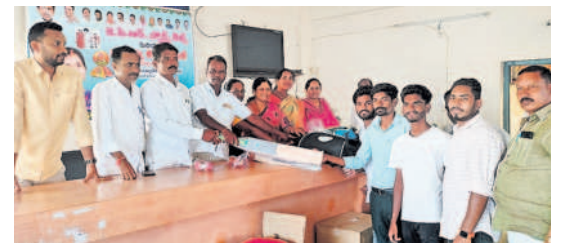
క్రీడా సామగ్రిని అందజేస్తున్న ఎంపీపీ భిక్షపతి