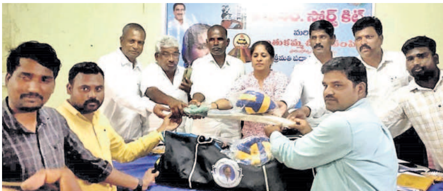
స్పోర్ట్స్ కిట్లు అందజేస్తున్న ప్రజా ప్రతినిధులు (ఫైల్)

మెడక్ రూరల్, అక్టోబర్ 4: రాష్ట్ర ప్రభుత్వం గ్రామీణ ప్రాంతాల్లోని క్రీడాకారుల్లో దాగి ఉన్న ప్రతిభను వెలికితీసేందుకు ప్రత్యేక చర్యలు తీసుకుంటున్నది. గ్రామీణ యువతకు క్రీడలపై ఆసక్తి ఉన్నప్పటికీ గ్రామీణ ప్రాంతాల్లో సరైన సౌకర్యాల లేక ఎంతో మంది క్రీడాకారుల దూరమయ్యారని, ప్రోత్సాహం ఇస్తే వారు మరింత ప్రతిభ చూపి రాష్ట్ర స్థాయి పోటీల్లోనూ రాణిస్తారనే గొప్ప సంకల్పంతో ముఖ్యమంత్రి కేసీఆర్ గ్రామానికో క్రీడా ప్రాంగణం ఏర్పాటు చేసేలా చర్యలు తీసుకున్నారు. ఈ మేరకు అధికారులు 'కేసీఆర్ స్పోర్ట్స్ కిట్' పేరుతో రాష్ట్ర వ్యాప్తంగా అన్ని గ్రామ పంచాయితీలకు ఆటవస్తువులు అందజేస్తున్నారు. గత ఏడాది జిల్లా వ్యాప్తంగా అన్ని గ్రామాల్లో క్రీడా ప్రాంగణాలు ఏర్పాటు చేశారు. అందులో వాల్ బాల్, ఖోఖో కోర్టు, లాంగ్ జంప్, సింగిల్ బాల్, డబుల్ బాల్లను సిద్ధం చేశారు. క్రీడాకారులు వ్యాయామం చేసేలా వసతులు కల్పించారు. దీంతో యువజన క్రీడల శాఖ ఆధ్వర్యంలో మండలంలోని 19 గ్రామ పంచాయితీలకు 20 'కేసీఆర్ స్పోర్ట్స్ కిట్స్' మంజూరయ్యాయి. కిట్లతో పాటు క్రీడాకారుల కోసం టీ పుర్లులు కూడా ఉన్నాయి. క్రీడలకు తెలంగాణ సర్కార్ పెద్దపీట వేసేందని 'కేసీఆర్ స్పోర్ట్స్ కిట్' పంపిణీతో గ్రామీణ ప్రాంతాల్లో విద్యార్థులు ఆటల్లో మరింత రాణించే అవకాశం ఉందని అధికారులు, నాయకులు పేర్కొంటున్నారు.