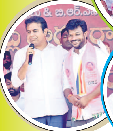
బోధ జిల్లాలోని ఎమ్మెల్యే అభ్యర్థి జానాపూర్ నాయక్ను పలకరించుచేస్తున్న మంత్రి కేటీఆర్