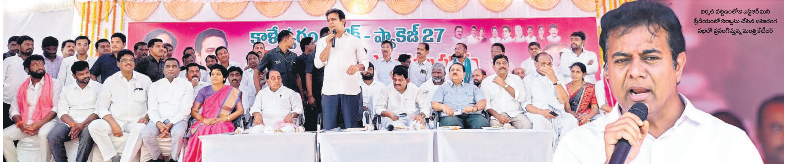
నిర్మల్ జిల్లా దిలావరపూర్ మండలం గుండంపల్లిలో ప్రసంగిస్తున్న మంత్రి కేటీఆర్, వేదికపై మంత్రి అల్లీల