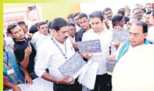
నిర్మల్ మున్సిపాలిటీ ప్రగతి నివేదిక లోచనం నిమిత్తం