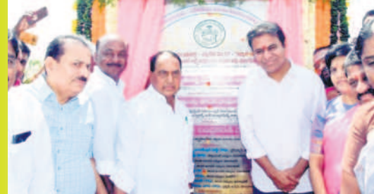
మంత్రి అల్లీలతో కలిసి కాళేశ్వరం ప్యాకేజీ-27 ఎత్తిపోతల పథకం శిలాపూజా నిమిత్తం మంత్రి కేటీఆర్