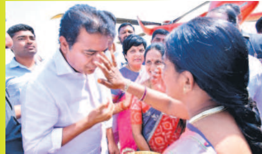
నిర్మల్ జిల్లా దిలావరపూర్ మండలం గుండంపల్లిలో మంత్రి కేటీఆర్ కు తిలకం పెడుతున్న మహిళ