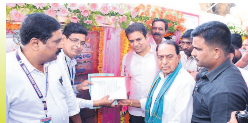
నిర్మల్ పట్టణంలో మున్సిపాలిటీ బుకల్ డిస్ అవిష్కరిస్తున్న మంత్రి కేటీఆర్, అల్లీల