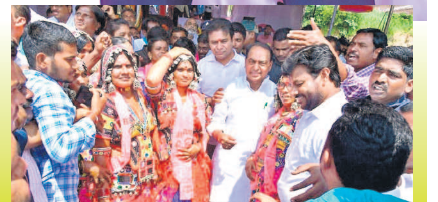
దిలావరపూర్ లో మంత్రి కేటీఆర్, అల్లీలతో గిరిజన మహిళలు