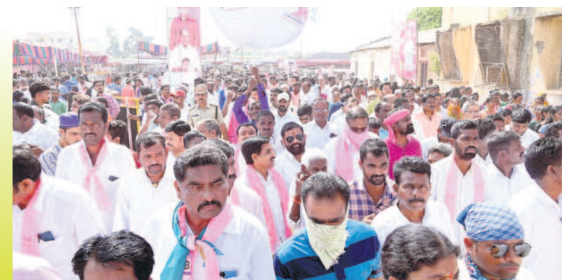
నిర్మల్ జిల్లా కేంద్రంలో నిర్వహించిన బహిరంగ సభకు తరలివచ్చిన శ్రేణులు, ప్రజలు