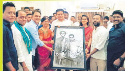
అల్లీల నివాసంలో మంత్రి కేటీఆర్ ను సన్మానిస్తున్న మంత్రి కుటుంబీకులు