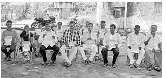
తాండూర్లో పోస్టాఫీస్ వద్ద సమ్మెలో పాల్గొన్న ఉద్యోగులు