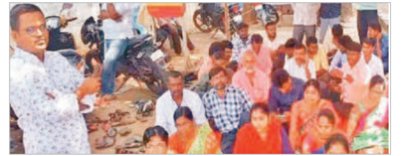
సమ్మెలో మాట్లాడుతున్న తపాలా ఉద్యోగ సంఘం నాయకుడు