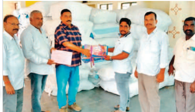
కల్వకుర్తిలో బతుకమ్మ చీరలను పంపిణీ చేస్తున్న ఎంపీడివో