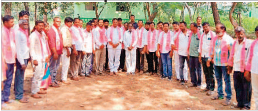
ఎమ్మెల్యే సమక్షంలో బీఆర్ఎస్ పార్టీలో చేరుతున్న ఆయా పార్టీల నాయకులు

కల్వకుర్తి రూరల్, సెప్టెంబర్ 21 : రాష్ట్రంలో బీఆర్ఎస్ ప్రభుత్వం చేస్తున్న అభివృద్ధిని చూసి ఆయా పార్టీల నాయకులు బీఆర్ఎస్ పార్టీలో చేరుతున్నారని ఎమ్మెల్యే జైపాల్ యాదవ్ అన్నారు. బుధవారం పట్టణం లోని ఎమ్మెల్యే