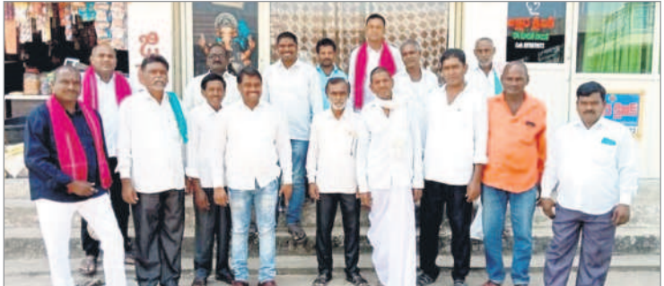
ఖానాపూర్ రూరల్ : మన్యూషూర్ నుంచి కేటీఆర్ సభకు తరలివెళ్తున్న బీఆర్ఎస్ నాయకులు