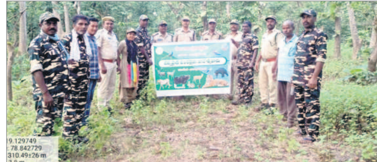
దస్తరాబాద్ : వన్యప్రాణుల సంరక్షణపై అవగాహన కల్పిస్తున్న అధికారులు