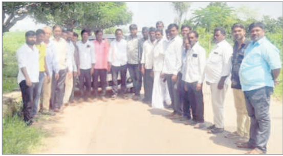
ఖానాపూర్ రూరల్ : రాజురా నుంచి కేటీఆర్ సభకు తరలివెళ్తున్న నాయకులు