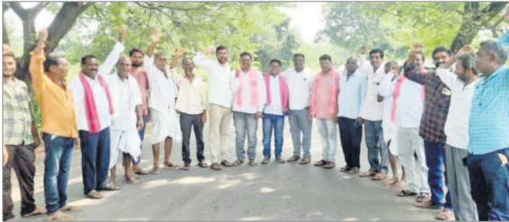
దస్తరాబాద్ : కేటీఆర్ సభకు బయలుదేరిన ప్రజాప్రతినిధులు, నాయకులు