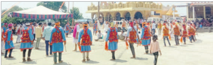
సంప్రదాయ దుస్తులతో నృత్యం చేస్తున్న మధురా(లఖాన్)కులస్తులు

ఇంద్రవెల్లి, అక్టోబర్ 4 : ఇంద్రవెల్లి పరిధిలోని అందునాయక్ తండాలో జ్వాలాముఖిదేవి, కాళు బాబా, పామబాబా ఆలయ ఆవరణలో రాంసింగ్ మహాశాస్త్రి ఆధ్వర్యంలో రుషి పంచమి ఉత్సవాలను మధురా(లఖాన్)సమాజ్ కులస్తుల ఆధ్వర్యంలో బుధవారం ఘనంగా ప్రారంభించారు. ఉత్సవాలకు రాజస్థాన్, గుజరాత్, మధ్య ప్రదేశ్, మహారాష్ట్ర, ఆంధ్రప్రదేశ్, తెలంగాణ నుంచి తరలివచ్చిన మధురా(లఖాన్)సమాజ్ కులస్తులు యువకులు, మహిళలు వేర్వేరుగా సంప్రదాయ నృత్యాలు చేశారు. వివిధ ప్రాంతాల నుంచి తరలివచ్చిన భక్తులు జ్వాలాముఖిదేవి,