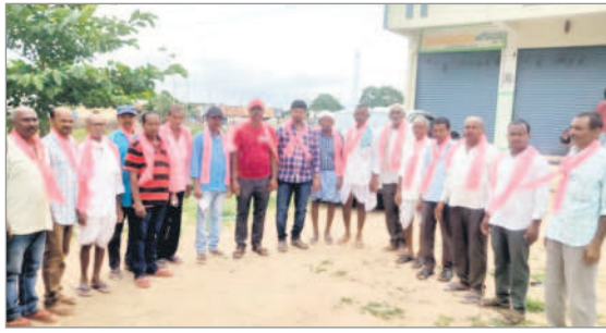
కడెం : నిర్వహణకు వెళ్తున్న నాయకులు