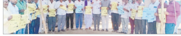
కరపత్రాలను విడుదల చేస్తున్న నాయకులు