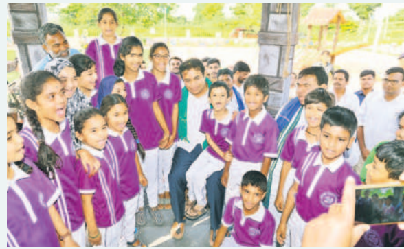
పాఠశాల విద్యార్థులతో మాట్లాడుతున్న మంత్రి కేటీఆర్, స్పీకర్ పోచారం