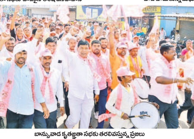
బాన్సువాడ కృతజ్ఞతా సభకు తరలివస్తున్న ప్రజలు

బాన్సువాడ రూరల్/బాన్సువాడ టౌన్/సమ్రాజ్ బాద్, అక్టోబర్ 4: బాన్సువాడ పట్టణంలోని వీటీ మార్కెట్ మైదానంలో నిర్వహించిన ఆర్కాడ కృతజ్ఞతా సభకు పెద్ద సంఖ్యలో జనం తరలివచ్చారు. నియోజకవర్గంలోని 9 మండలాల నుంచి భారీగా పాల్గొన్నారు. వివిధ రవాణా మార్గాల్లో స్వచ్ఛందంగా వచ్చి బీఆర్ఎస్ అభ్యర్థి, స్థానిక ఎమ్మెల్యే పోచారం శ్రీనివాస రెడ్డికి మద్దతు తెలిపారు. సభకు హాజరైన దాదాపు లక్ష మంది జనమిలా అల్పిదారులే కావడం విశేషం. ఆడుగుడునూ కేసీఆర్, కేటీఆర్, స్పీకర్ పోచారం కటౌట్లు.. గులాబీ జెండాలు, తోరణాలతో పట్టణ మంతా గులాబీమయమైంది. చాలా మంది పట్టణవాసులు స్వచ్ఛందంగా తమ వ్యాపార, వాణిజ్య వాణాజీ మూసే సుకొని బీఆర్ఎస్ బహిరంగ సభకు తరలివెళ్లారు.