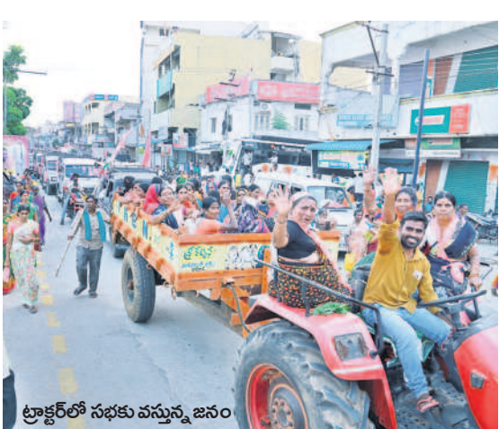
ట్రాక్టర్ తో సభకు వస్తున్న జనం