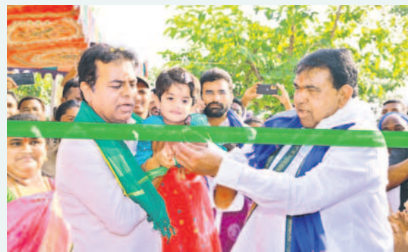
చిన్నారి తో కలిసి పార్కును ప్రారంభిస్తున్న మంత్రి కేటీఆర్, స్పీకర్ పోచారం