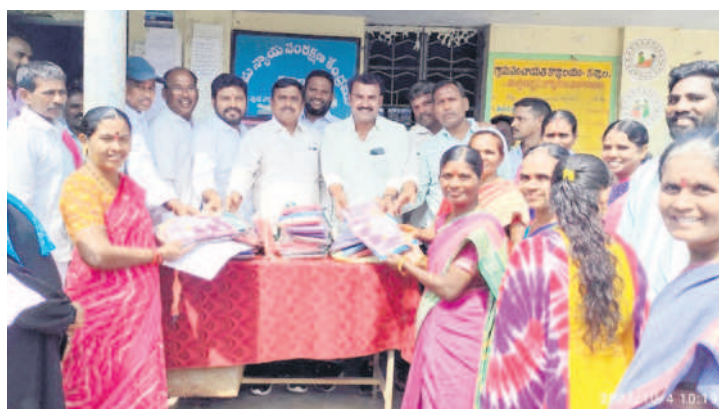
పాలకల్ల: కన్వాలలో చీరలు పంపిణీ చేస్తున్న అధికారులు, నాయకులు