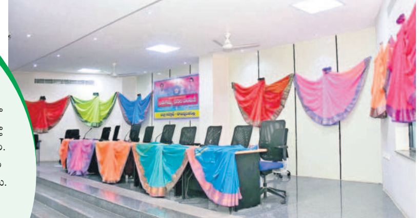
సిరిసిల్లలో వివిధ రంగుల్లో తయారైన బతుకమ్మ చీరలు