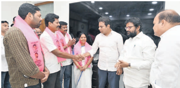
బీఆర్ఎస్లో చేరిన కాంగ్రెస్, బీజేపీలకు చెందిన ముగ్గురు కార్యకర్తలను ఆహ్వానిస్తున్న మంత్రి కేటీఆర్