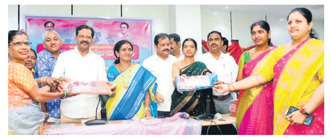
ఆకర్షణీయంగా బతుకమ్మ చీరలు