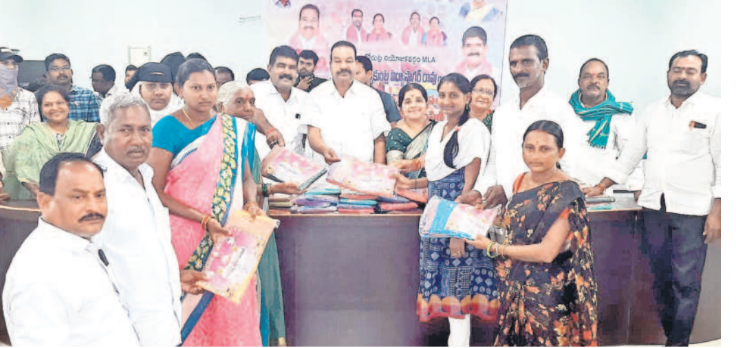
కోరుట్ల రూరల్: బతుకమ్మ చీరలను పంపిణీ చేస్తున్న ఎమ్మెల్యే కల్వకుంట్ల విద్యాసాగర్ రావు

బతుకమ్మ పండుగ మహిళలకు ప్రత్యేకం. పండుగకు కొత్త బట్టలు కట్టుకోవాలన్న లక్ష్యంతో సీఎంకేసీఆర్ ఇంటికి పెద్దవాడిగా చీరలు పెడుతున్నాడు. బతుకమ్మ చీరలు మంచిగున్నయే. రంగులు, డిజైన్లు బాగున్నయే. ఇంత మంచి ఆలోచన గతంలోని ప్రభుత్వాలకు చేయలేదు. పేదల బతుకులు, కష్టాలు తెలిసిన కేసీఆర్ సరే అందరూ సంతోషంగా ఉండాలని ఈ పథకం తెచ్చిండు. ఎన్నో మంచి పనులు చేస్తున్న కేసీఆర్ మళ్లీ సీఎం కావాలి. - శారద, కరీంనగర్