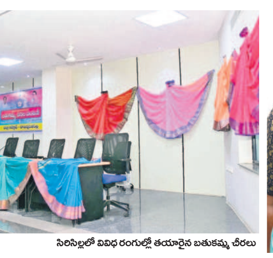
సిరిసిల్లలో వివిధ రంగుల్లో తయారైన బతుకమ్మ చీరలు