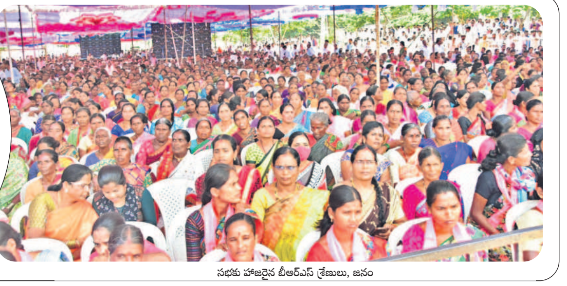
సభకు హాజరైన బీఆర్ఎస్ శ్రేణులు, జనం