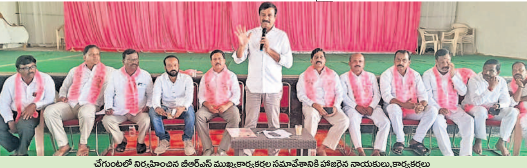
చేగుంటలో నిర్వహించిన బీఆర్ఎస్ ముఖ్యకార్యకర్తల సమావేశానికి హాజరైన నాయకులు, కార్యకర్తలు