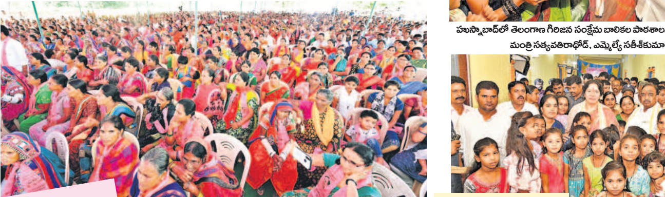
అక్కినపేటలో గిరిజన ఆశ్రయ సమ్మేళనానికి భారీగా హాజరైన మహిళలు