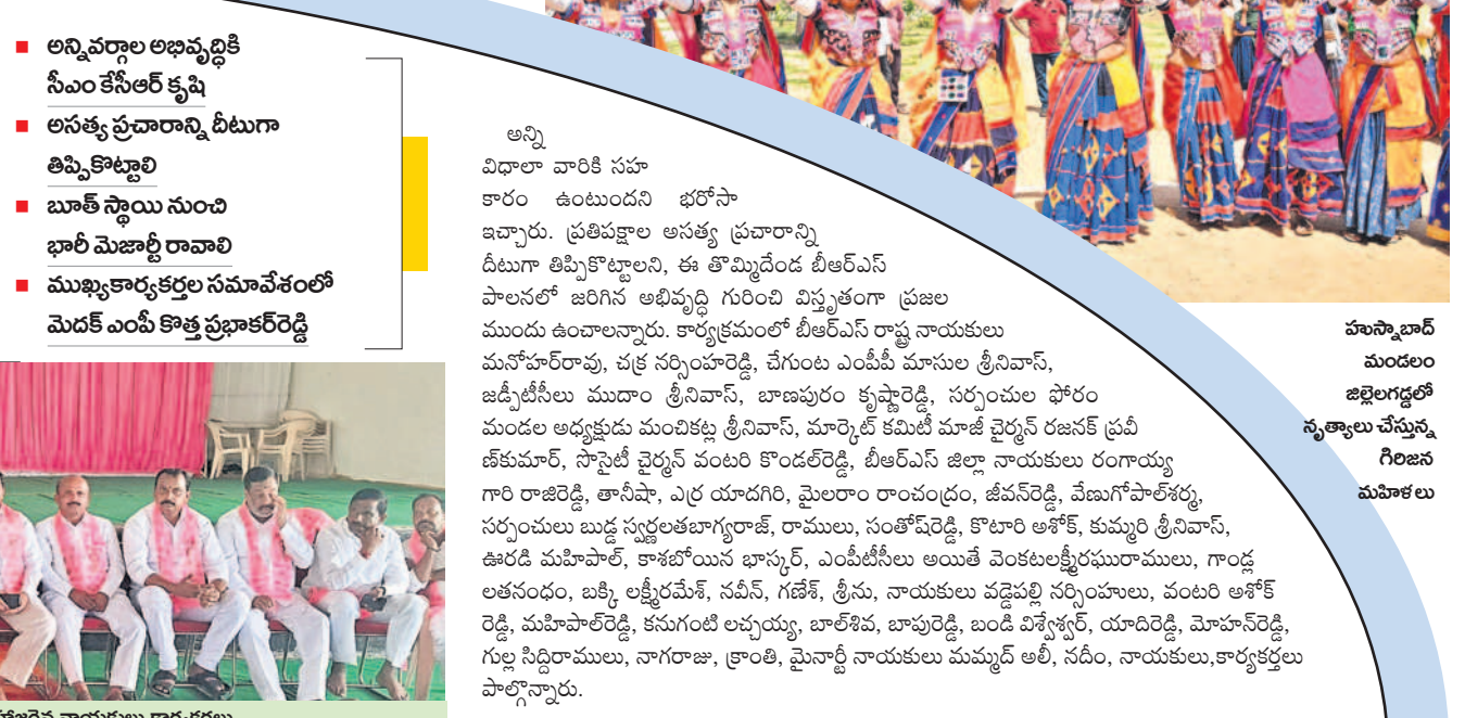
హుస్సాబాద్ మండలం జిల్లాలగర్లలో నృత్యాలను చేస్తున్న గిరిజన మహిళలు