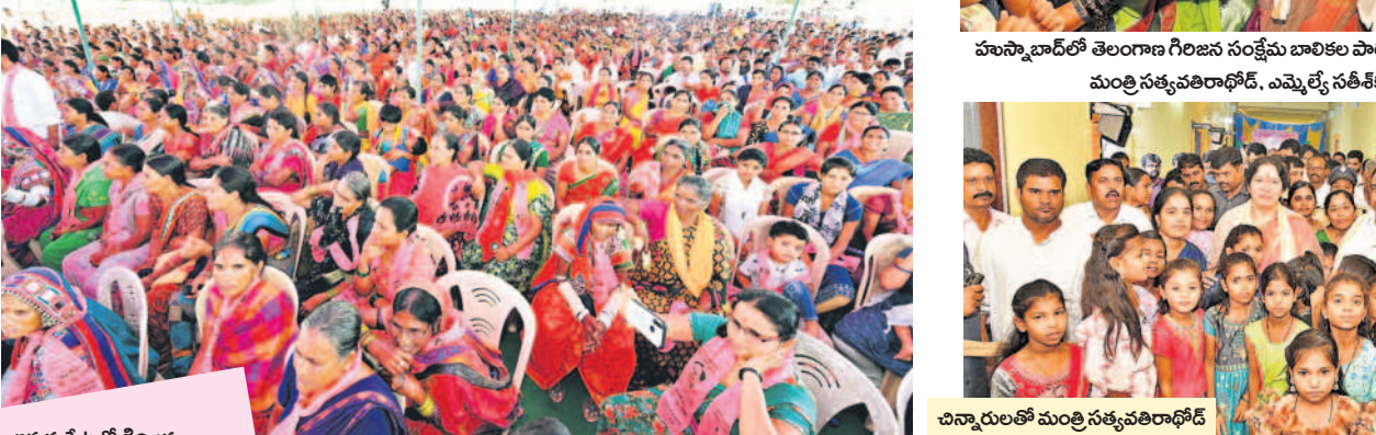
అక్కన్నపేటలో గిరిజన ఆశ్రయ సమ్మేళనానికి భారీగా హాజరైన మహిళలు