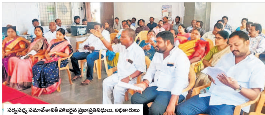
సర్పంచ్ సమావేశానికి హాజరైన ప్రజాప్రతినిధులు, అధికారులు