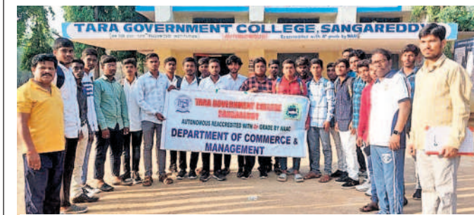
కోర్సు ప్రారంభోత్సవానికి హైదరాబాద్ వెళ్తున్న తారా విద్యార్థులు