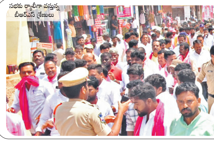
సభకు రాత్రిగా వస్తున్న బీఆర్ఎస్ శ్రేణులు