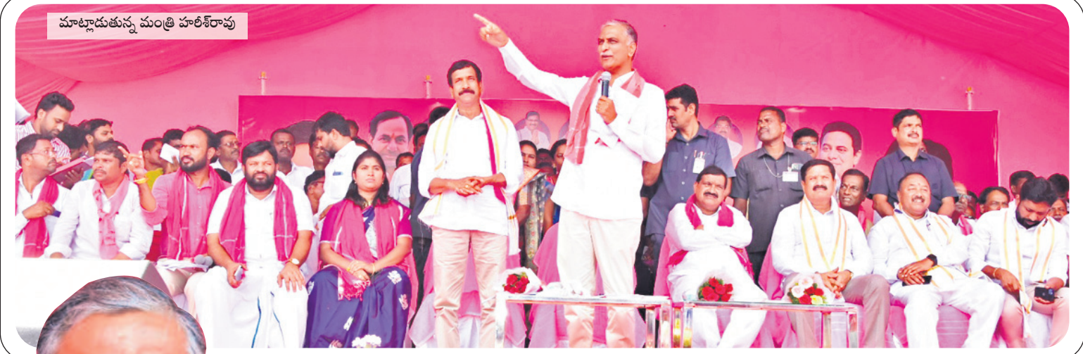
మాట్లాడుతున్న మంత్రి హరిశ్చంద్ర