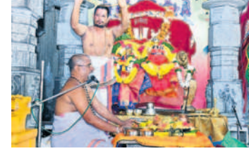
స్వామి, అమ్మవార్ల నిత్య తిరుకల్యాణోత్సవం నిర్వహిస్తున్న అర్చకులు

యాదగిరిగుట్ట, అక్టోబర్ 4 : యాదగిరిగుట్ట లక్ష్మీనరసింహస్వామి ఆలయంలో బుధవారం నిత్యసుదర్శన నారసింహహోమం అత్యంత వైభవంగా సాగింది. ఉదయం ప్రధానాలయంలోని కల్యాణ మండపంలో ఉత్సవమూర్తులను అదిష్టించి సుదర్శన ఆస్వాదనం కోలుస్తూ నారసింహ హవనం నిర్వహించారు. తెల్లవారుజామాన ఆలయాన్ని తెరిచిన అర్చకులు సుప్రభాతంతో స్వయంభూ నారసింహస్వామిని మేల్కొల్పారు. అనంతరం తిరువారాధన జరిపి, ఉదయం ఆరగింపు చేపట్టారు. స్వయంభూ ప్రధానాలయంలో స్వామివారికి నిజాభిషేకం జరిపారు. స్వామివారికి తులసీ సహస్రనామార్చన, అమ్మవారికి కుంకుమార్చన, అంజనేయస్వామికి సహస్రనామార్చన చేపట్టి భక్తులకు స్వామి, అమ్మవార్ల దర్శన భాగ్యం కల్పించారు. స్వామి, అమ్మవార్లను దివ్యమహోహరంగా ముస్తాబు చేసి గజవాహనంపై వేంచేపు చేసి వెలుపలి ప్రాకార మండపంలో ఊరేగించారు. అనంతరం లక్ష్మీనమేతుడైన కల్యాణ మూర్తులను ముస్తాబు చేసి భక్తులకు అభిముఖంగా అదిష్టించి నిత్యకల్యాణ తంతును జరి