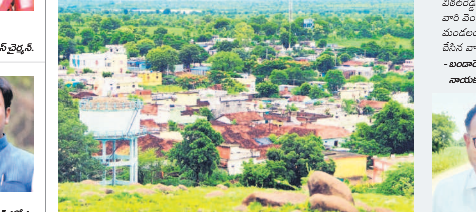
బెత్తకోడ గ్రామ ముఖచిత్రం