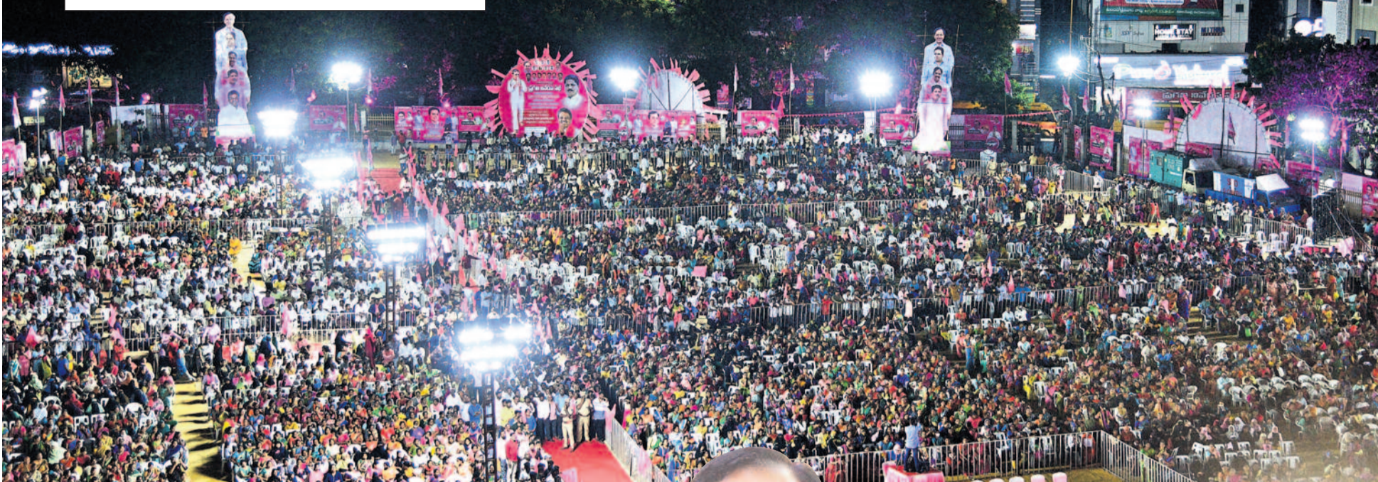
కూకట్‌పల్లిలో గురువారం సాయంత్రం జరిగిన ప్రగతినివేదన సభకు భారీగా తరలి వచ్చిన జనం

శుక్రవారం FRIDAY 6.10.2023 కరీంనగర్ KARIMNAGAR పేజీలు: 16+16/12 Pages: 16+16/12 శుక్రవారం, సూర్యోదయం: 6-07, సూర్యాస్తమయం: 6-01. శ్రీ శోభకృత్ నామ సంవత్సరం దక్షిణాయనం వర్ష రుతువు భాద్రపద మాసం కృష్ణ పక్షం తిథి: సప్తమి ఉదయం 6-35 వరకు, తదవల అష్టమి, నక్షత్రం: ఆరుద్ర రాత్రి 9-31 వరకు. వర్షం: లేదు. రాహుకాలం: ఉదయం 10-35 నుంచి పగలు 12-04 వరకు. దుర్భుకార్యం: ఉదయం 8-30 నుంచి ఉదయం 9-17 వరకు, పునర్ దుర్భుకార్యం: పగలు 12-27 నుంచి పగలు 1-15 వరకు. అమృతకాలం: ఉదయం 10-45 నుంచి పగలు 12-28 వరకు.