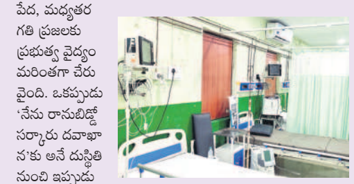
మెట్వల్ల ప్రభుత్వ దవాఖానలో బిసెయి విభాగం కట్టా కడుతున్న పరిస్థితి కనిపిస్తున్నది. కోరుట్ల, మెట్వల్ల పట్టణాల్లోని ప్రభుత్వ దవాఖానలు ప్రసవార్లో రాష్ట్ర స్థాయిలో ప్రత్యేక గర్భింపును పొందాయి. కోరుట్ల కేంద్రంగా వందల పడకల దవాఖానను ప్రభుత్వం మంజూరు చేసి, నిధులు విడుదల చేయగా, భవన నిర్మాణం పూర్తయింది. శుక్రవారం మంత్రి హరీశ్ రావు చేతులమీదుగా ప్రారంభోత్సవానికి అంకా సిద్ధమైంది. ఇంకా కోరుట్ల పట్టణంలో ఏర్పాటు చేసిన ఐస్టిదవాఖాన పేదలకు సంజీవనంగా మారింది. కిక్కి బాధితులు డయాలసిస్ కోసం హైదరాబాద్, నిజామాబాద్, కరీంనగర్ వంటి పట్టణాలకు వెళ్తున్న అవసరం లేకుండా కోరుట్లలో ఈ యోదా జనవరి 5న సెంటర్ ను ఏర్పాటు చేయడం బాధితులకు స్వాగతం కలిగిస్తున్నది.

మెట్వల్ల పట్టణంలోని రూ.7.5 కోట్ల నిధులతో 30 పడకల దవాఖాన సామర్థ్యం పెంచుతూ ఆధునాతనమైన వసతులతో కూడిన కొత్త భవన నిర్మాణ పనులు చకచక కొనసాగుతున్నాయి. కోరుట్ల, మెట్వల్ల పట్టణాల్లో పాటు ఇబ్రహీంపట్నం, మల్లాపూర్, మెట్వల్ల, కోరుట్ల మండలాలలో రూ.7.20 కోట్ల నిధులతో 36 ఆరోగ్య ఉపకేంద్రాలకు పక్కా భవనాల నిర్మాణం కోసం కేంద్ర ప్రభుత్వం నిధులు కేటాయింపగా, కోరుట్ల, మెట్వల్ల పట్టణాల్లో ప్రత్యేక నిధులు రూ.100 కోట్లతో మౌలిక సదుపాయాల కల్పించారు. జాతీయ రహదారి మద్దల్లో డివైడర్ల నిర్మించి అధునాతనమైన విద్యుత్ దీపాలు, పచ్చదనం కోసం మొక్కలు ఏర్పాటు చేశారు. రెండు మున్సిపాలిటీల్లో అభివృద్ధి, సంక్షేమం లక్ష్యంగా ఇచ్చిన హామీలకు మించి పనులు చేశారు. మిషన్ భగీరథ పనులతో దిబ్బాతిన్న కాలనీల్లో అంతర్గత రోడ్లు, డ్రైనేజీ నిర్మాణాలు చేపట్టారు. వంద పడకల దవాఖాన నిర్మాణంతో పేద, మధ్య తరగతి కుటుంబాలకు మెరుగైన వైద్య సేవలు అందుతాయి. ప్రజా సంక్షేమం లక్ష్యంగా పనులు చేశారు.