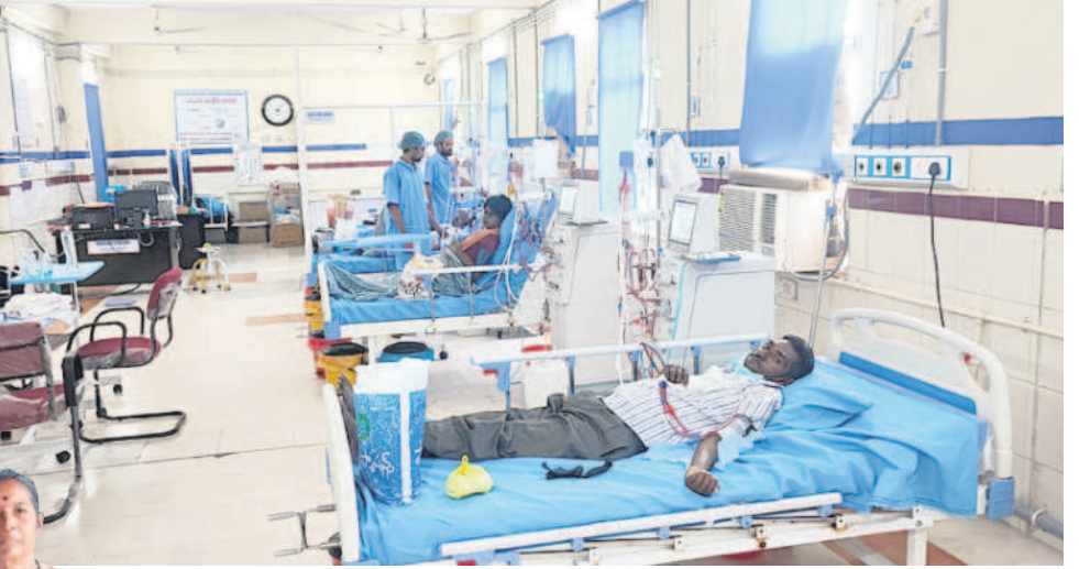
కిడ్నీ రోగులకు సేవలందిస్తున్న డయాలసిస్ సెంటర్

కోరుట్ల, కథలాపూర్, మేడిపల్లి, మెట్వల్ల పట్టణాల్లో పాటు ఇబ్రహీంపట్నం, మల్లాపూర్, రాయకల్ మండలాల పరిధిలోని ప్రజలకు దవాఖానలో ఆధునిక మెరుగైన వైద్య సేవలు, శస్త్ర చికిత్సలు అందుతున్నాయి. కోరుట్ల కమ్యూనిటీ సెంటర్ ద్వారా ఇప్పటికే ఆయా మండలాల పరిధిలోని 60 గ్రామాల ప్రజలకు వైద్య సేవలు కొనసాగుతుండగా వంద పడకల అందుబాటులోకి వచ్చే కార్పొరేట్ కు దీటుగా అన్ని రకాల వైద్య సేవలు, శస్త్ర చికిత్సలు చేరుతున్నాయి.