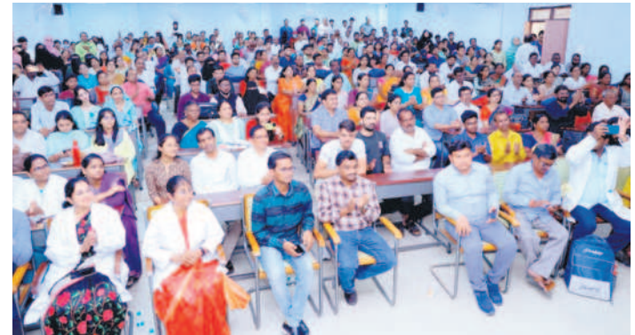
హాజరైన ప్రాఫెసర్లు, విద్యార్థుల తల్లిదండ్రులు