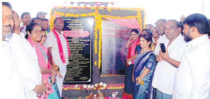
కప్పరావుపేటలో అభివృద్ధి పనుల శిలాఫలకాన్ని ఆవిష్కరిస్తున్న మంత్రి కొప్పుల ఈశ్వర్

వెల్లూరు, అక్టోబర్ 5: వచ్చే ఆరేండ్లలో అర్బులందరికీ దళితబంధు మంజూరు చేస్తామని రాష్ట్ర ఎస్సీ అభివృద్ధి, మైనార్టీ, దివ్యాంగ సంక్షేమ శాఖల మంత్రి కొప్పుల ఈశ్వర్ ప్రకటించారు. ఏ ఒక్కరూ ఆందోళన చెందవద్దని సూచించారు. గురువారం వెల్లూరు మండలంలోని కప్పారావు పేటలో ₹ 1.05 కోట్లతో పంచాయతీ భవనం,