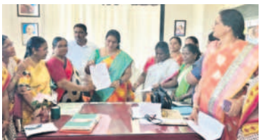
విధుల్లో చేరిన డిడబ్ల్యువో విజేతకు

భద్రాద్రి కొత్త గూడెం, అక్టోబర్ 5 (నమస్తే తెలంగాణ): సుమారు నెల రోజుల పాటు సమ్మెలో ఉన్న అంగన్వాడీ టీచర్లు గురువారం విధుల్లో చేరారు. ఈ మేరకు జిల్లా సంక్షేమ అధికారి కార్యాలయంలో డిడబ్ల్యువో విజేతకు ఆయా సంఘాల నాయకులతో కలిసి జాయినింగ్ రిపోర్ట్ అందించారు. ప్రభుత్వం తమ సమస్యలను అర్థం చేసుకుని పరిష్కరించడం చాలా సంతోషకరమని కొనియాడారు. సమ్మెకాలంలోనూ వేతనం ఇస్తామని ప్రకటించడం ఆనందాన్నిచ్చిందన్నారు. తమకు రిటైర్మెంట్ బెన్ఫిట్ పెంచినందుకు సీఎం కేసీఆర్ కు రుణపడి ఉంటామన్నారు.