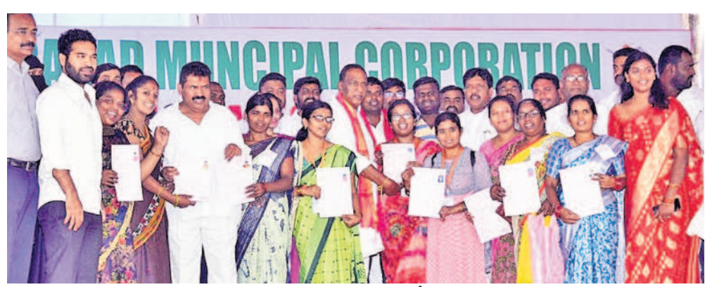
ూరహలిపల్లిలో లజ్డిదారులకు డబుల్ బెడ్రారూమ్ ఇండ్ల పట్టాలను పంపిణీ చేసిన మంత్రి మల్లారెడ్డి, ఎమ్మెల్ఫే ముఠాగోపాల్