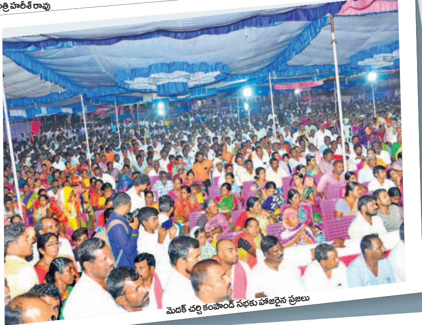
మెదక్ చర్ల కంపౌండ్ సభకు హాజరైన ప్రజలు