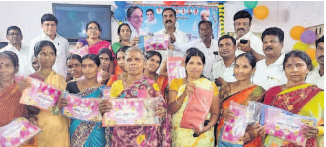
వెల్పూర్లో బతుకమ్మ చీరలను పంపిణీ చేస్తున్న ఎంపీపీ స్వరూప, జడ్పీటీసీ