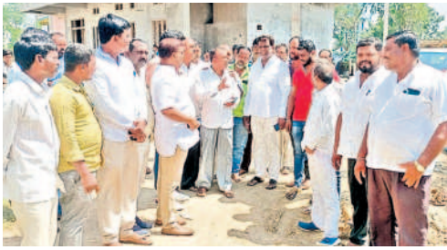
శివ్వంపేటలో సీసీరోడ్డు కోసం కాలనీలో పరిశీలిస్తున్న జడ్పీటీసీ