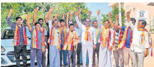
చందూర్ నుంచి మెదక్ తరలివెళ్తున్న కురుమ సంఘం సభ్యులు