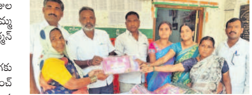
యేనగండ్లలో చీరలను పంపిణీ చేస్తున్న ఎంపీపీ మంజుల