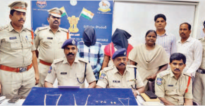
వివరాలు వెల్లడిస్తున్న ఎస్పీ నరసింహ