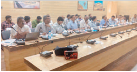
తుంగభద్ర బోర్డు సమావేశంలో పాల్గొన్న మూడు రాష్ట్రాల ఎస్కాలు