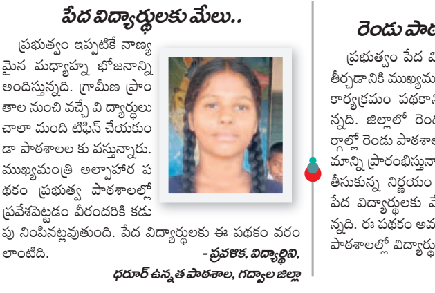
వేద విద్యార్థులకు మేలు.. ప్రభుత్వం వేద విద్యార్థులకు ఆకలి తీర్చడానికి ముఖ్యమంత్రి అల్పాహార కార్యక్రమం పథకాన్ని ప్రారంభిస్తున్నది.

నేడు అల్పాహార పథకం ప్రారంభం ప్రభుత్వం వేద విద్యార్థులకు ఆకలి తీర్చడానికి ముఖ్యమంత్రి అల్పాహార కార్యక్రమం పథకాన్ని ప్రారంభిస్తున్నది. జిల్లాలో రెండు నియోజకవర్గాల్లో రెండు పాఠశాలల్లో ఈ కార్యక్రమం మూర్తి ప్రారంభిస్తున్నాయి. ప్రభుత్వం తీసుకున్న నిర్ణయం ఎంతో మంచి వేద విద్యార్థులకు మేలు చేశారని మేద పాఠశాలలో ప్రభుత్వ పాఠశాలల్లో విద్యార్థుల సంఖ్య మరింతగా పెరిగి అవకాశమవుతుంది. - సాతాద్రిగి, డి.జి.జి, జోగుశాంబ గద్వాల