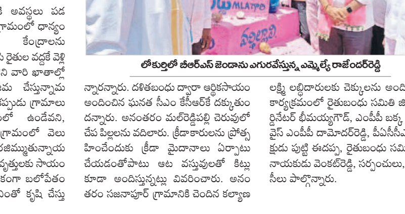
నారాయణపేట ఎమ్మెల్యే రాజేందర్ రెడ్డి లోకుర్తి, మల్ రెడ్డిపల్లి, మొగల్ మద్క గ్రామాల్లో బీఆర్ఎస్ జెండావిప్పురణ

నారాయణపేట ఎమ్మెల్యే రాజేందర్ రెడ్డి లోకుర్తి, మల్ రెడ్డిపల్లి, మొగల్ మద్క గ్రామాల్లో బీఆర్ఎస్ జెండావిప్పురణ పాల్గొని, అక్టోబర్ 5 : ప్రతిఒక్కరూ ఆర్థికంగా ఎదిగడమే సీఎం కేసీఆర్ లక్ష్యమని ప్రజా నారాయణపేట ఎమ్మెల్యే రాజేందర్ రెడ్డి అన్నారు. గురువారం మండలంలోని తరం 133/11 కేవీ సబ్ స్టేషన్ ను ప్రారంభించి మాట్లాడుతూ రైతులను రాజును చేయడమే లక్ష్యంగా ముందుకు సాగుతున్న క్రమంలో రైతులకు నాణ్యమైన ఉచిత విద్యుత్, కావాలి నన్ను ఏర్పాటు చేసేందుకు ప్రయత్నం చేస్తున్నట్లు తెలిపారు. అంతేకాకుండా రైతులు చదివించిన పంటలను అమ్ముకోవడానికి అవకాశం పడకుండా ప్రతి గ్రామంలో ధాన్యం కొనుగోలు కేంద్రాలను ఏర్పాటు చేసి రైతుల వడ్డీ వెళ్లి ధాన్యం కొని వారి ఖాతాల్లో సగటు జమ చేస్తున్నామన్నారు. ఒక్కప్పుడు గ్రామాల అందకంలో ఉండేవని, నేడు ప్రతిగ్రామంలో వెలుగులు విరజిమ్ముతున్నాయన్నారు. కులవృత్తులకు సాయం అందించే అర్థికంగా బలోపేతం చేయడంతోపాటు ఉత్తీర్ణత పెరుగుదలపై ప్రజలను చూపిస్తుంది.