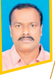
- నర్సింహాచలు, డిఆర్డీవో, వనపర్తి

9,166, మణుపురం 12,454, గోపాల్ పేట 12,741, కొత్త కోట 18,953, మదనాపురం 9,228, పాస్ గల్ 15,224, పెట్టేర్ 16,637, పెద్దమందడి 12,448, రేపల్లి 7,140, శ్రీరంగాపురం 6,362, వీపనగండ్ల 8,833, వనపర్తి 32,245 చీరలు అందించనున్నారు.